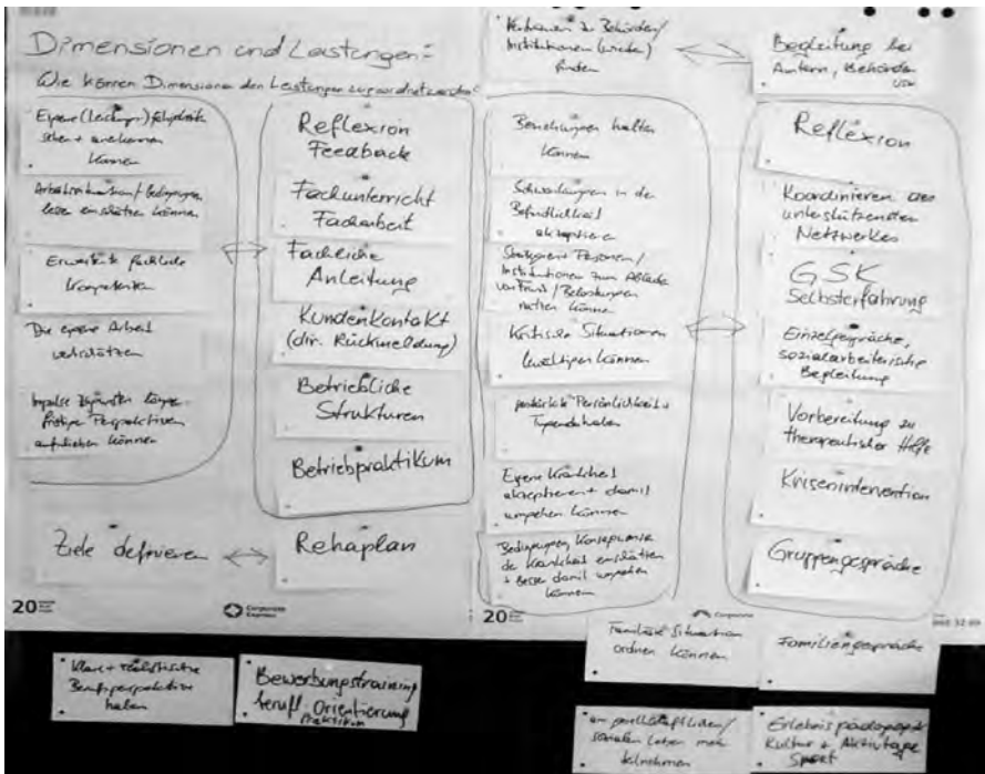
Abbildung 2: Wirkmodell – Zuordnung der ATZ-Leistungen zu den Wirkdimensionen

Auf welchen der beiden Ebenen nun siedelt die Handlungspraxis die Dimensionen im Wirkmodell an? Eine systematische Trennung und Zuordnung fällt besonders